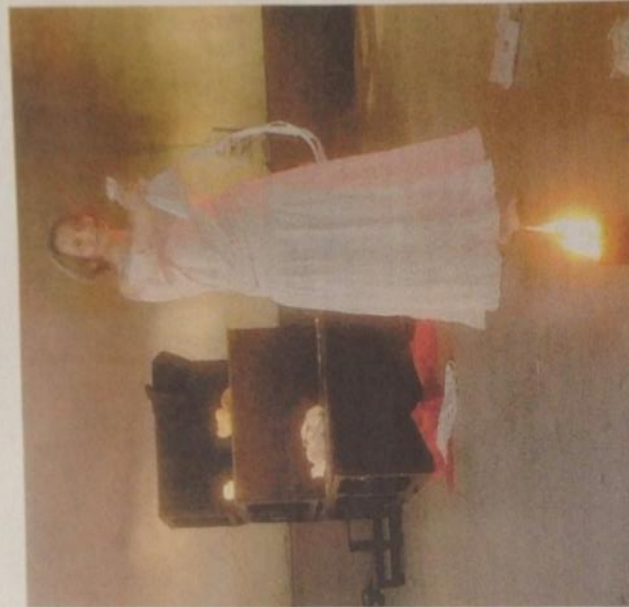
L'attrice Viviana Magoni in scena nel salone di San Benedetto Belbo.

L'ingresso è libero. A Ormea, domenica 28 alle 15, è prevista anche una lettura e un laboratorio con la compagnia, aperta ai bambini e alle famiglie. In via di definizione, ancora ad agosto, una recita all'Astignano, a Calamandrana, mentre è già annunciata una ripresa, il 16 novembre, al Cinema veki- kio di Cornelliano.