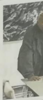
Una scena di Spider-Man

Midsommar - il villaggio dei dannati sala 4 ore 21